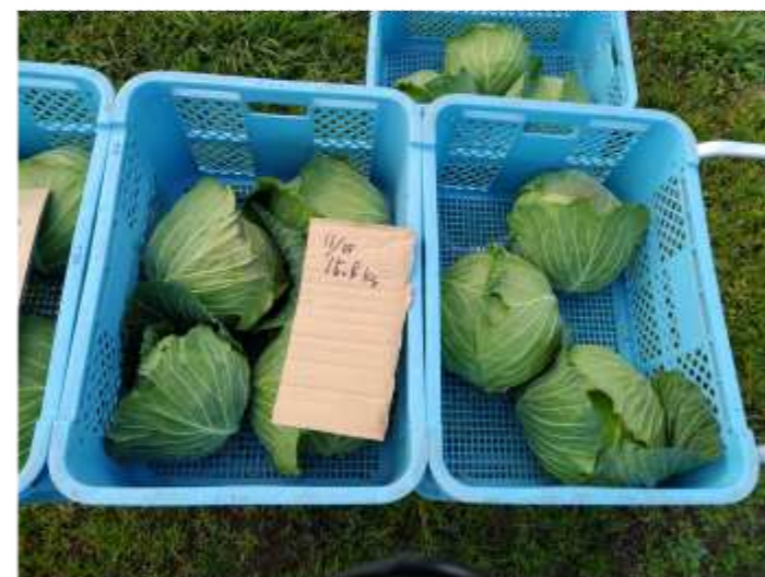
キャベツの収穫、学校給食に出荷