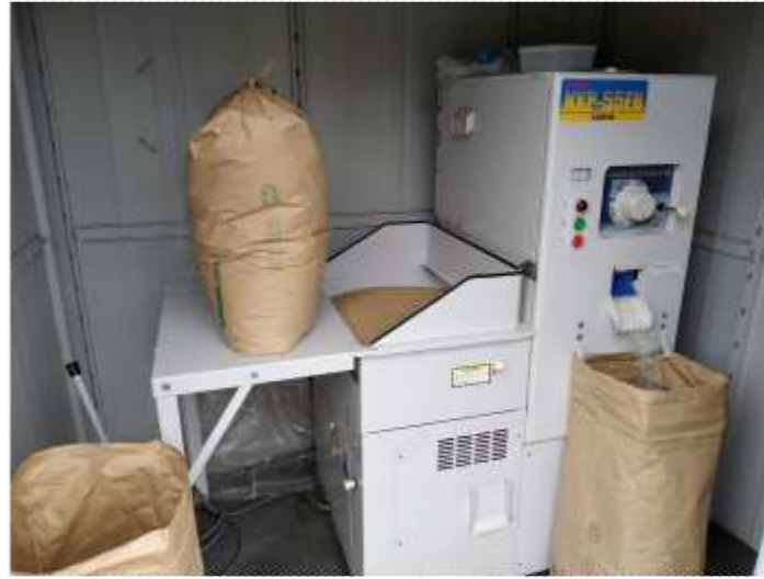
精米機、集会所にあります