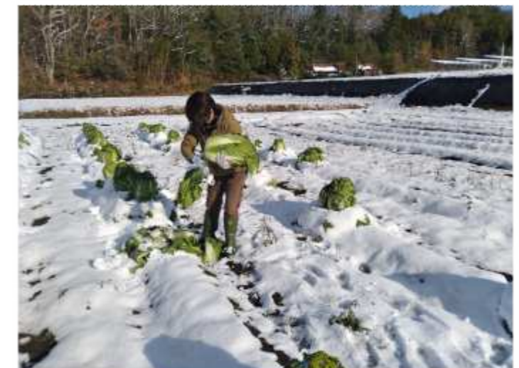
ハクサイの収穫、埋もれて凍る