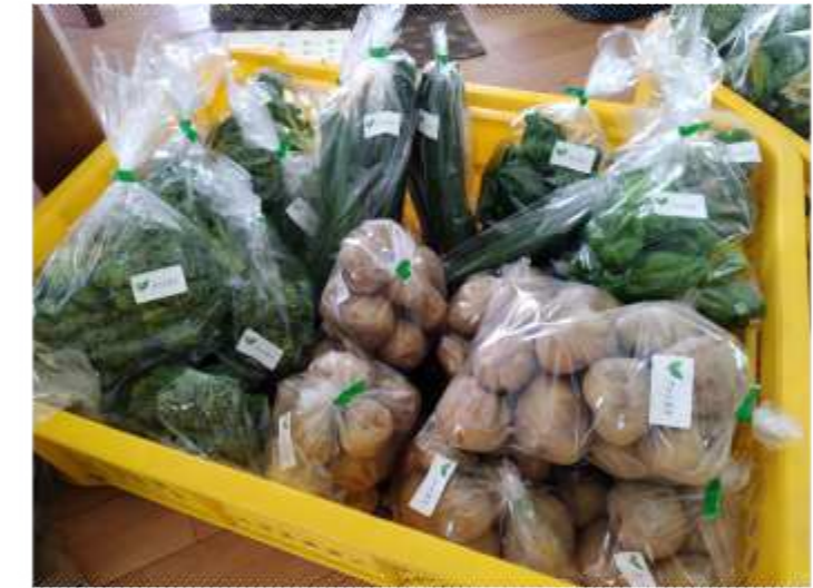
少量の野菜は産直市やスーパーへ出荷