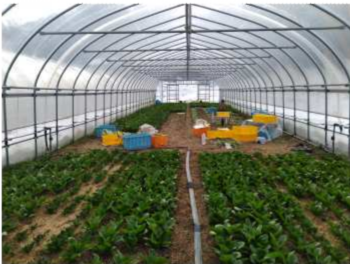
ほうれん草の収穫、冬場は冷蔵庫