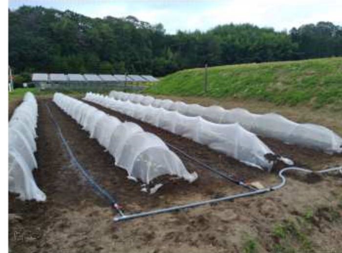
灌水システム、上手いかず…