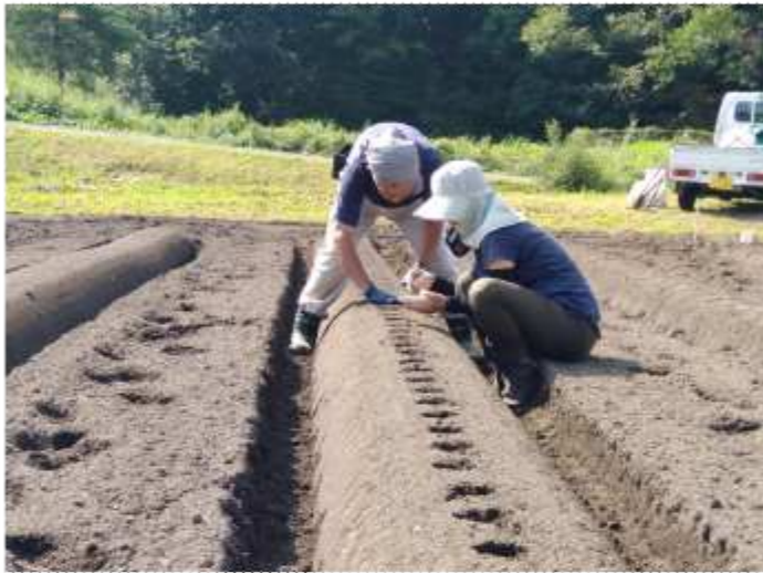
ダイコンの種まき、腰に堪えそう