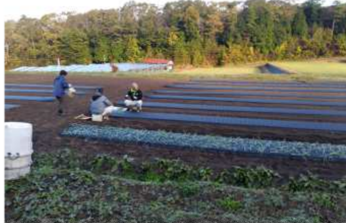
タマネギの苗植え、37,000本！