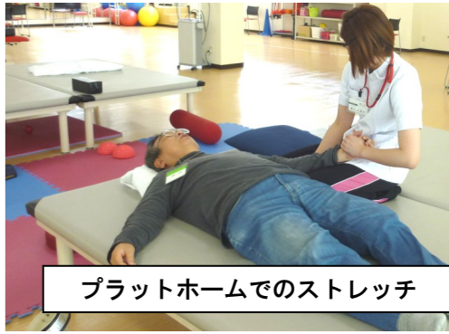
プラットホームでのストレッチ