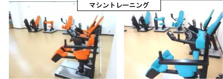
マシントレーニング