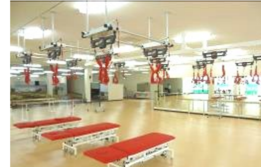
レッドコード(スリングエクササイズ)