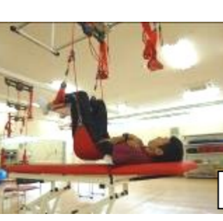
ウォーターエルゴ