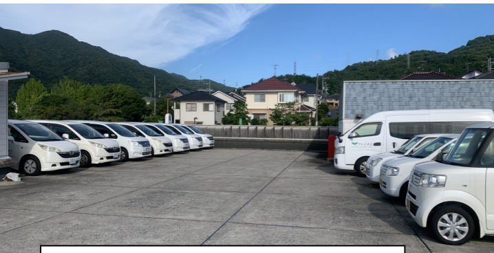
屋上駐車場(送迎車両18台)

QOLの向上 ただ単に「自宅で生活できる」というだけではなく、もっと生活を豊かに楽しく過ごせるためのお手伝いをします。 介護予防 その人の生活・人生を尊重し、できる限り自立した生活を送れるよう生活機能の維持・向上を積極的に図り、高齢者本人の自己実現の達成を支援します。 地域に根ざした施設 多くの利用者様に慕われると共に、地域社会に望まれ必要とされるデイサービスにするために、利用者様のご意見・ご希望を聞き、一緒に創造していくことを目指します。